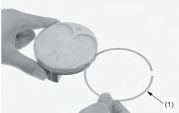
(1) verwijderde zuigerveer