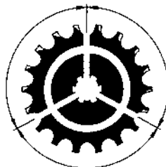
Normale kettingwiel tand