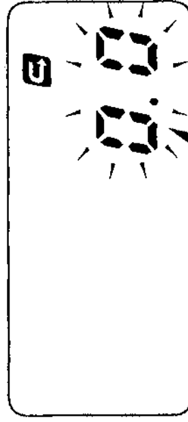
減算トリップ数字点滅