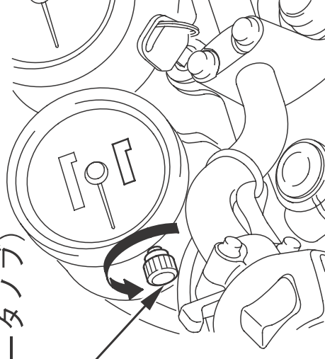
区間距離計ノブ (トリップメータノブ)