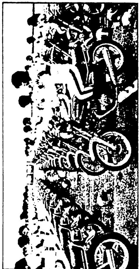
● H M S (ホンダ・モーターサイクル・スクール) の訓練風景。

出合頭事故に注意。見通しのわるい交差点では必ずいったん停止・徐行を習慣づけましょう。(正しい安全運転の知識は、小冊子「セーフティライディング・セーフティポイント」で詳しく解説しています。ご一読ください。ヘルメットを正しくかぶりましょう。S.S.Gマークのついた乗車用ヘルメットをかぶり、あごひもは正しく締めましょう。