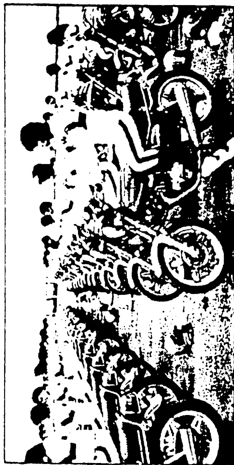
●HMS (ホンダ・モーターサイクル・スクール) の訓練風景。

S、SG マークのついた乗車用ヘルメットをかぶり、あごひもは正しく締めましょう。