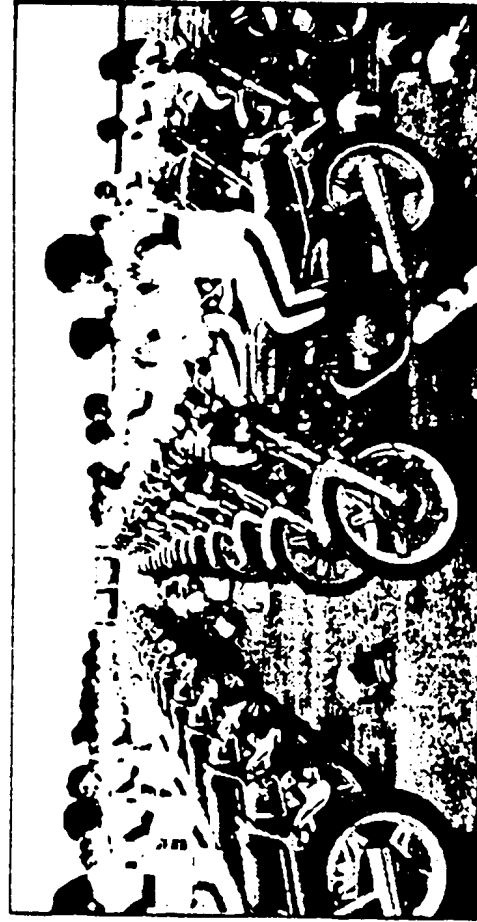
●H.M.S(ホンダ・モーターサイクルリスト・スクール)の訓練風景。