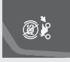
後輪の ABS 機能が OFF(停止)