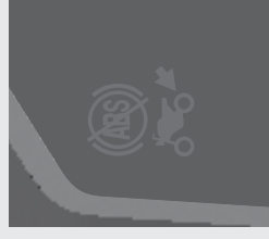
前後輪の ABS 機能が ON(有効)